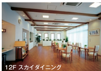
12F スカイダイニング